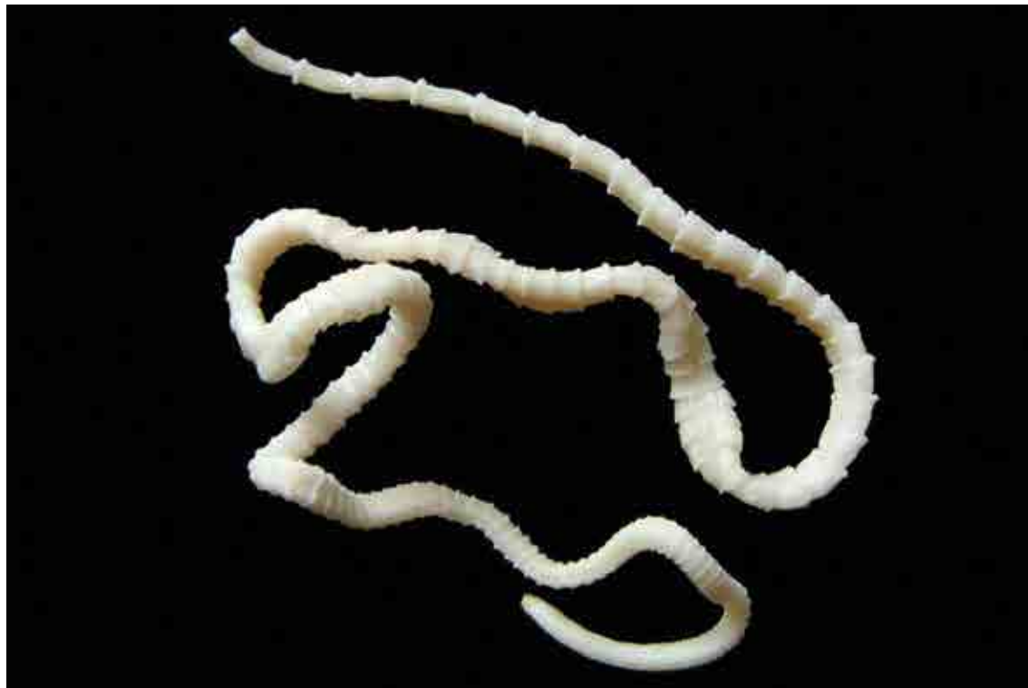
Figura 2. Taenia solium en estado adulto. La longitud que puede alcanzar una tenia adulta es de hasta dos metros de longitud, ocupando prácticamente el ~30% del intestino delgado, donde puede llegar a vivir por varios años.