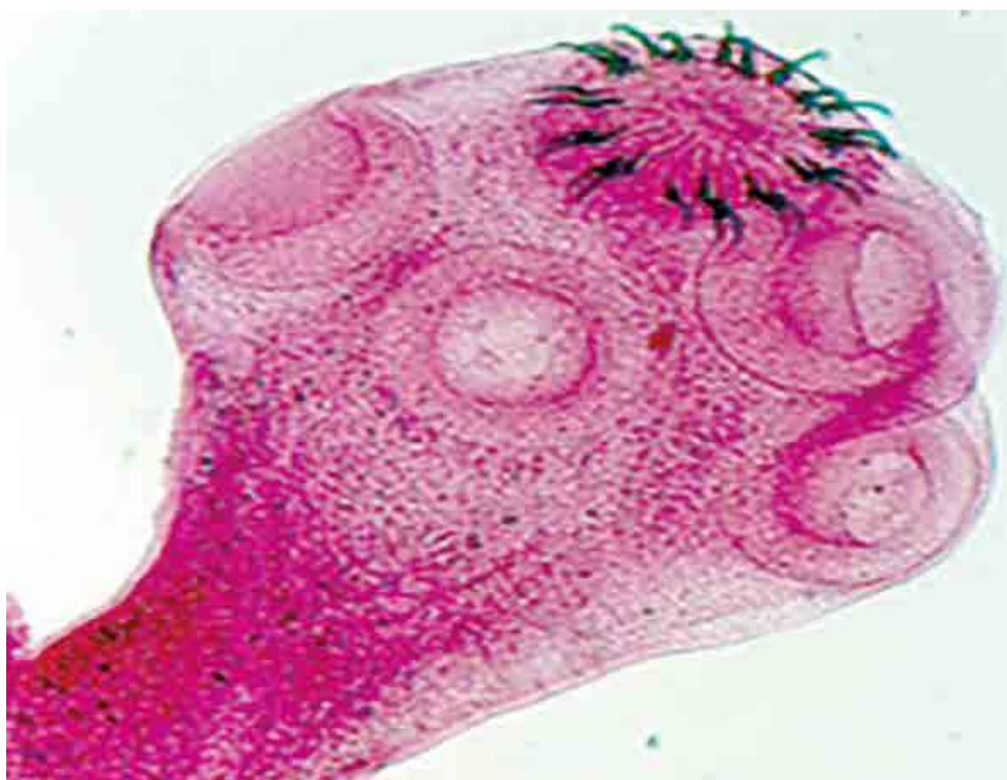
Figura 3. Escolex de Taenia solium .