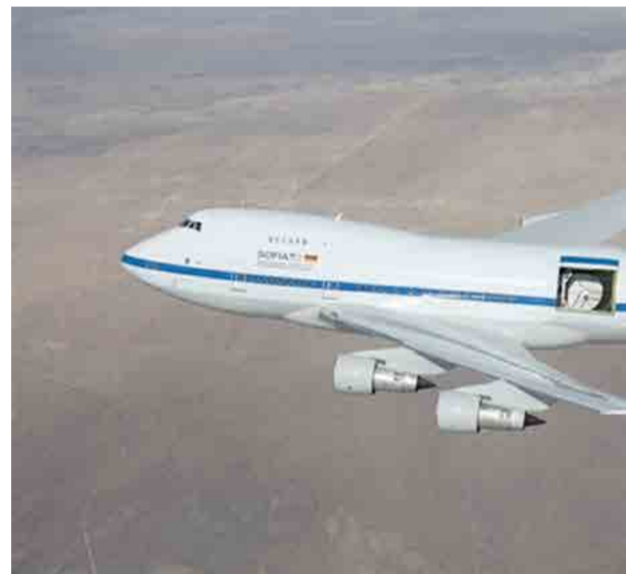
Figura 2. SOFIA, el observatorio estratosférico para astronomía infra-roja. Mas información: https://es.wikipedia.org/wiki/SOFIA

de la abundancia del primero aumentó y el hidruro de helio desapareció. Solo hasta hace poco se propuso que podría existir en el medio interestelar que rodea a estrellas, es decir, en nebulosas planetarias. Sin embargo, su detección no había sido posible ya que tiene un espectro de vibración y rotación muy parecido al de la molécula de CO (monóxido de carbono) y \text{CH}_4 (metano), moléculas que son abundantes en nuestra atmósfera. Las frecuencias en que se observan los espectros vibracionales y rotacionales de la mayoría de las moléculas se encuentran en el infrarrojo e infrarrojo lejano, es decir, en longitudes de onda de unos cuantos micrómetros (microondas). Esta es la misma longitud de onda que utiliza un horno de microondas casero